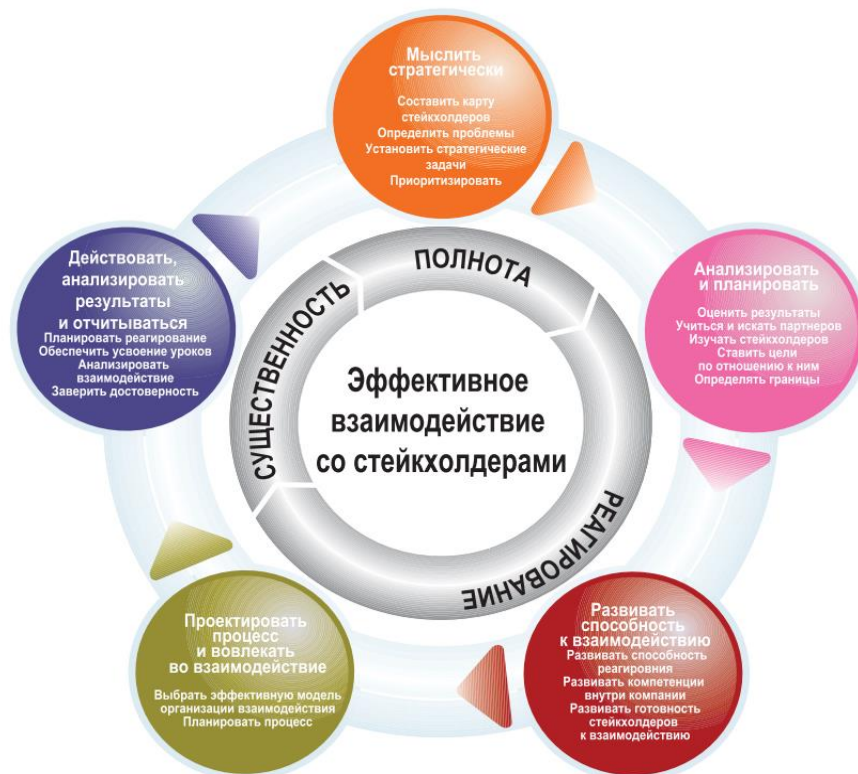
Рисунок 1. Развитие взаимодействия с заинтересованными сторонами

Источник: От слов к делу. Взаимодействие с заинтересованными сторонами. Выпуск 2: Практическое руководство по организации взаимодействия со стейкхолдерами. AccountAbility, Программа ООН по охране окружающей среды и Stakeholder Research Associates, 2005. Стр. 11.